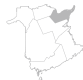
Zone 6 Région de Bathurst et de la Péninsule acadienne