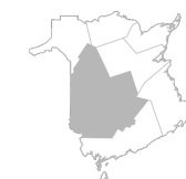
Zone 3 Région de Fredericton et de la vallée