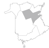
Zone 7 Région de Miramichi