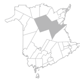
Communauté Région de Miramichi, Rogersville, Blackville