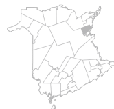
Communauté Région de Neguac, Alnwick, Esgenopetitj