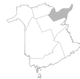
Zone 6 Région de Bathurst et de la Péninsule acadienne