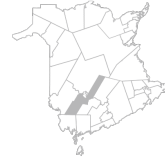
Communité Région de New Maryland, Kingsclear, Lincoln