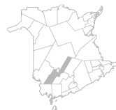
Communauté Région de New Maryland, Kingsclear, Lincoln