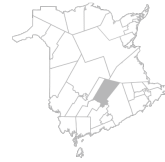
Communauté Région de Minto, Chipman, Cambridge-Narrows