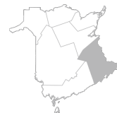
Zone 1 Région de Moncton et du Nouveau-Brunswick Sud-Est