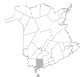
Communauté Région de St. George, Grand Manan, Blacks Harbour