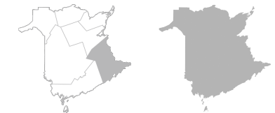
Zone 1 Région de Moncton et du Sud-Est Province Nouveau-Brunswick