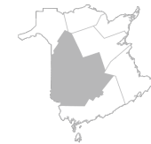
Zone 3 Région de Fredericton et de la vallée Province Nouveau-Brunswick