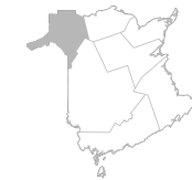
Zone 4 Région du Madawaska et du Nord-Ouest Province Nouveau-Brunswick