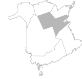
Zone 7 Région de Miramichi