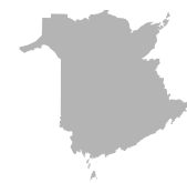
Zone 4 Région du Madawaska et du Nord-Ouest Province Nouveau-Brunswick