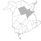
Communauté Région de Miramichi, Rogersville, Blackville