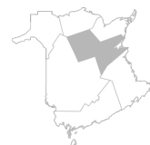
Zone 7 Région de Miramichi