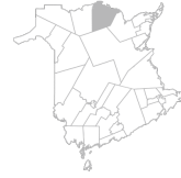
Communauté Région de Dalhousie, Balmoral, Belledune