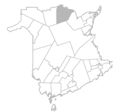
Communauté Région de Dalhousie, Balmoral, Belledune