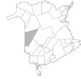
Communauté Région de Florenceville-Bristol, Woodstock, Wakefield