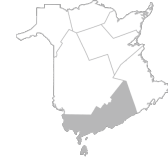
Zone 2 Région de Fundy et de Saint John