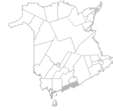
Communité Saint John, Simonds et Musquash