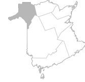
Zone 4 Région du Madawaska et du Nouveau-Brunswick Nord-Ouest