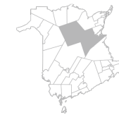
Communauté Région de Miramichi, Rogersville, Blackville