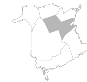
Zone 7 Région de Miramichi