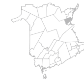
Communauté Région de Neguac, Alnwick, Esgenopetitj