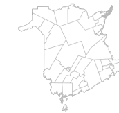
Communauté Région de Shippagan, Lamèque, Inkerman