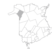
Communauté Région de Grand- Sault, Saint- Léonard, Drummond