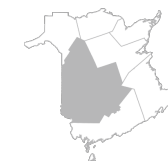
Zone 3 Région de Fredericton et de Nouveau-Brunswick la vallée