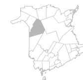
Communauté Région de Perth-Andover, Plaster Rock, Tobique