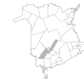
Communité Région de New Maryland, Kingsclear, Lincoln