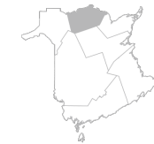
Zone 5 Région de Restigouche