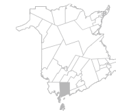
Communauté Région de St. George, Grand Manan, Blacks Harbour