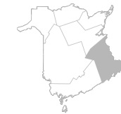
Zone 1 Région de Moncton et du Nouveau-Brunswick Sud-Est