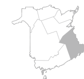
Zone 1 Région de Moncton et du Nouveau-Brunswick Sud-Est