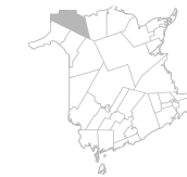
Communauté Kedgwick, Saint-Quentin et Grimmer